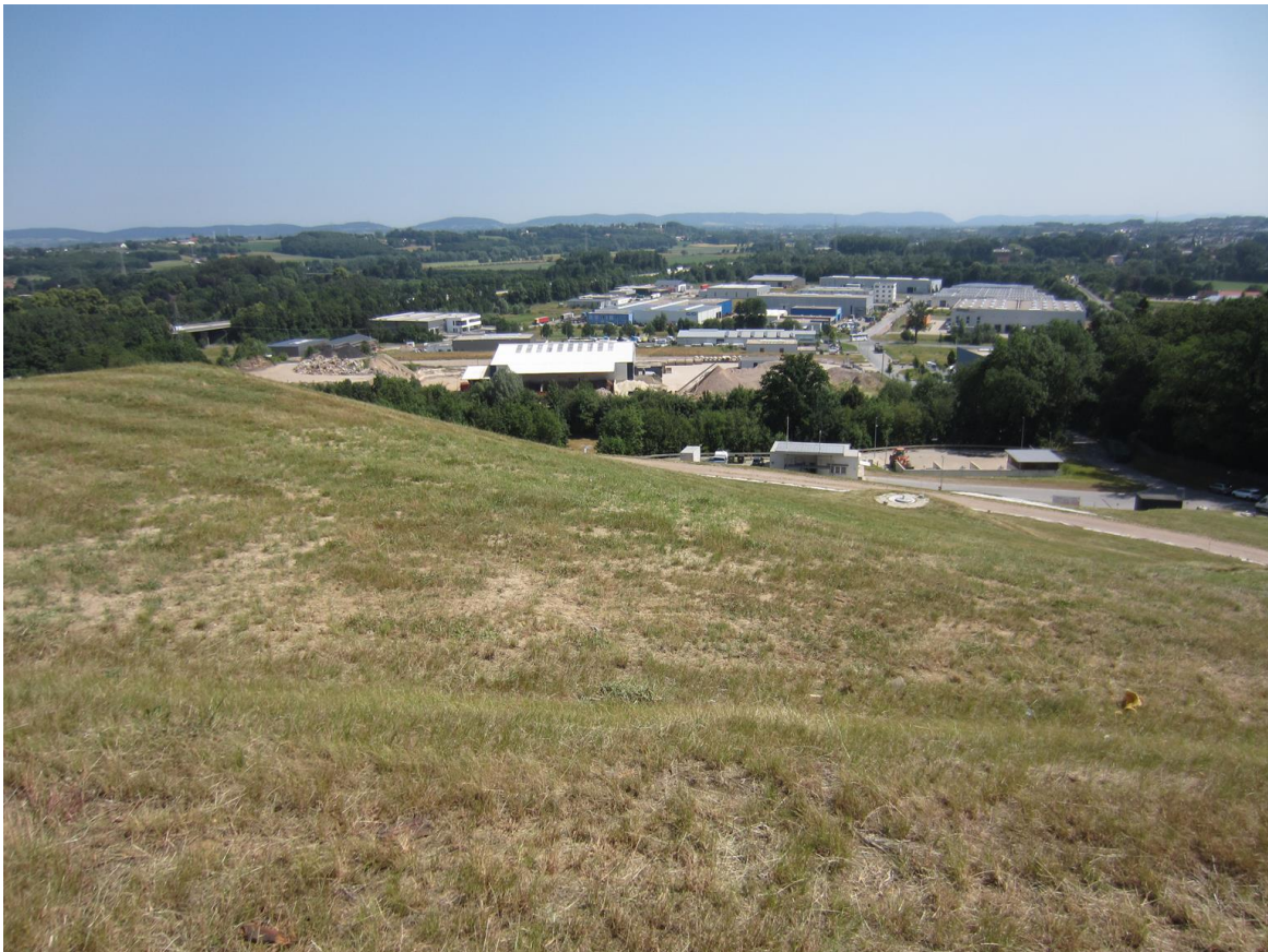
Blick auf die abgedeckte Fläche der Deponie, auf der die PV Anlage errichtet werden soll

Für die Vorbereitung und Durchführung der Planung hat sich die FEGH der Leistungen eines Architekten, einer Statikerin und eines Anlagenbauers versichert. Ohne deren fachkundiger Hilfe und dem unermüdlichen Einsatz der aktiven Energiegenoss*innen und Teilen der Kreisverwaltung wäre das Vorankommen und eine Realisierung nicht gelungen. Als generelle Hindernisse, die bis zur Baugenehmigung zu meistern waren, seien hier (nicht vollständige Listung) genannt: